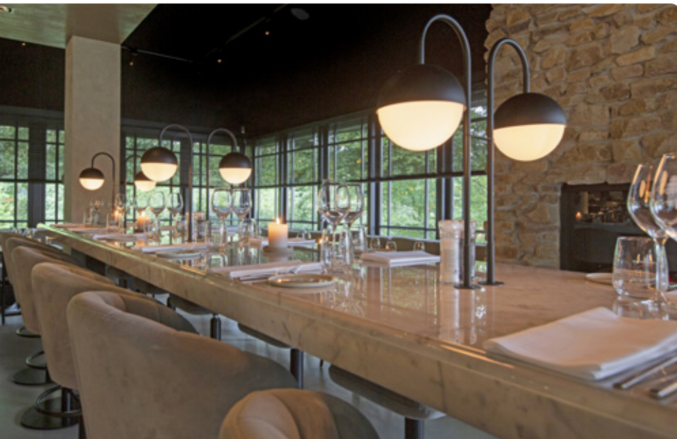
Fotografie: Bistrobar Beaune