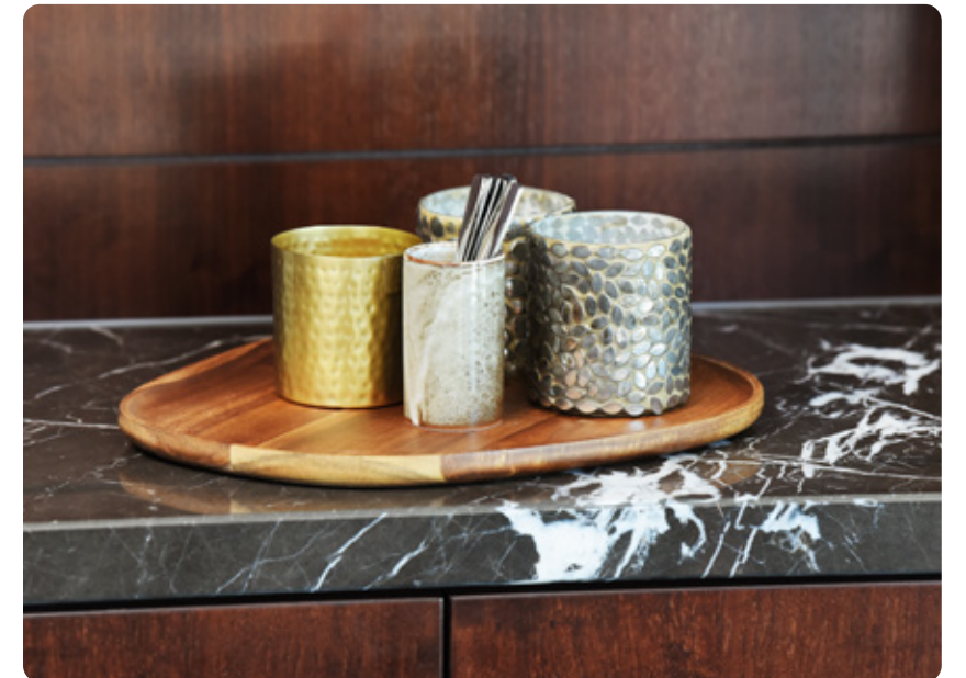
NOIR SAINT LAURENT MARMER • GEPOLIJST

Marmer kan vaak ook in 'open boek' worden gebruikt. Hierbij worden 2 platen gespiegeld aan elkaar geplaatst.