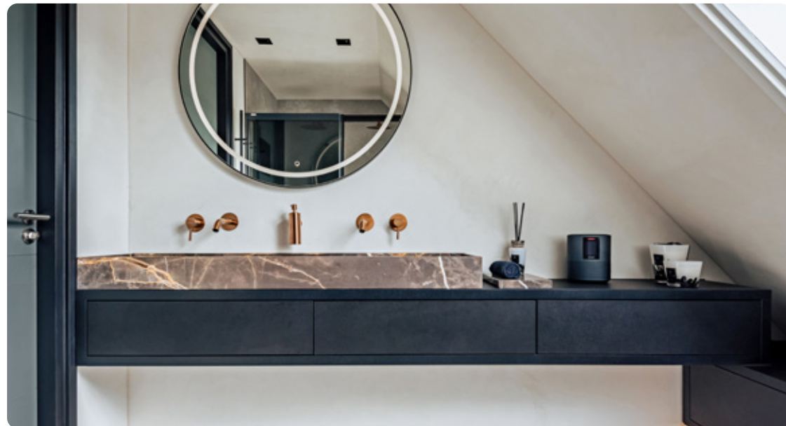
BRONZE F MARMER • LEATHER-FINISH

Ook binnenshuis is hetzelfde marmer gebruikt voor alle werkbladen in de keuken en de badkamer.