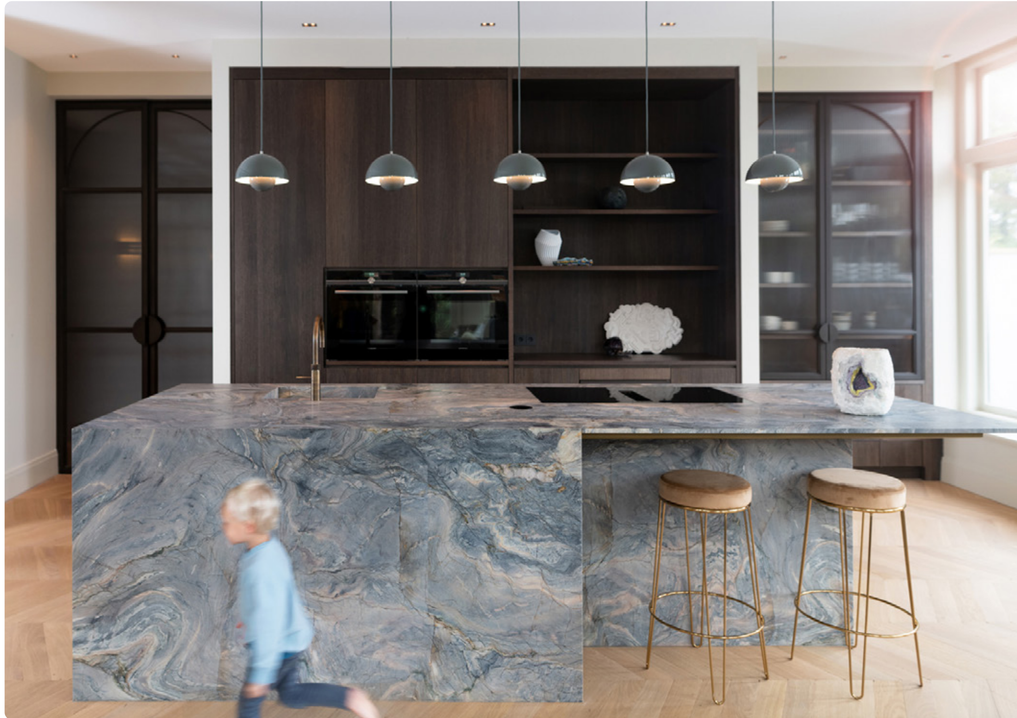
EXPLOSION BLUE KWARTSIET • LEATHER-FINISH