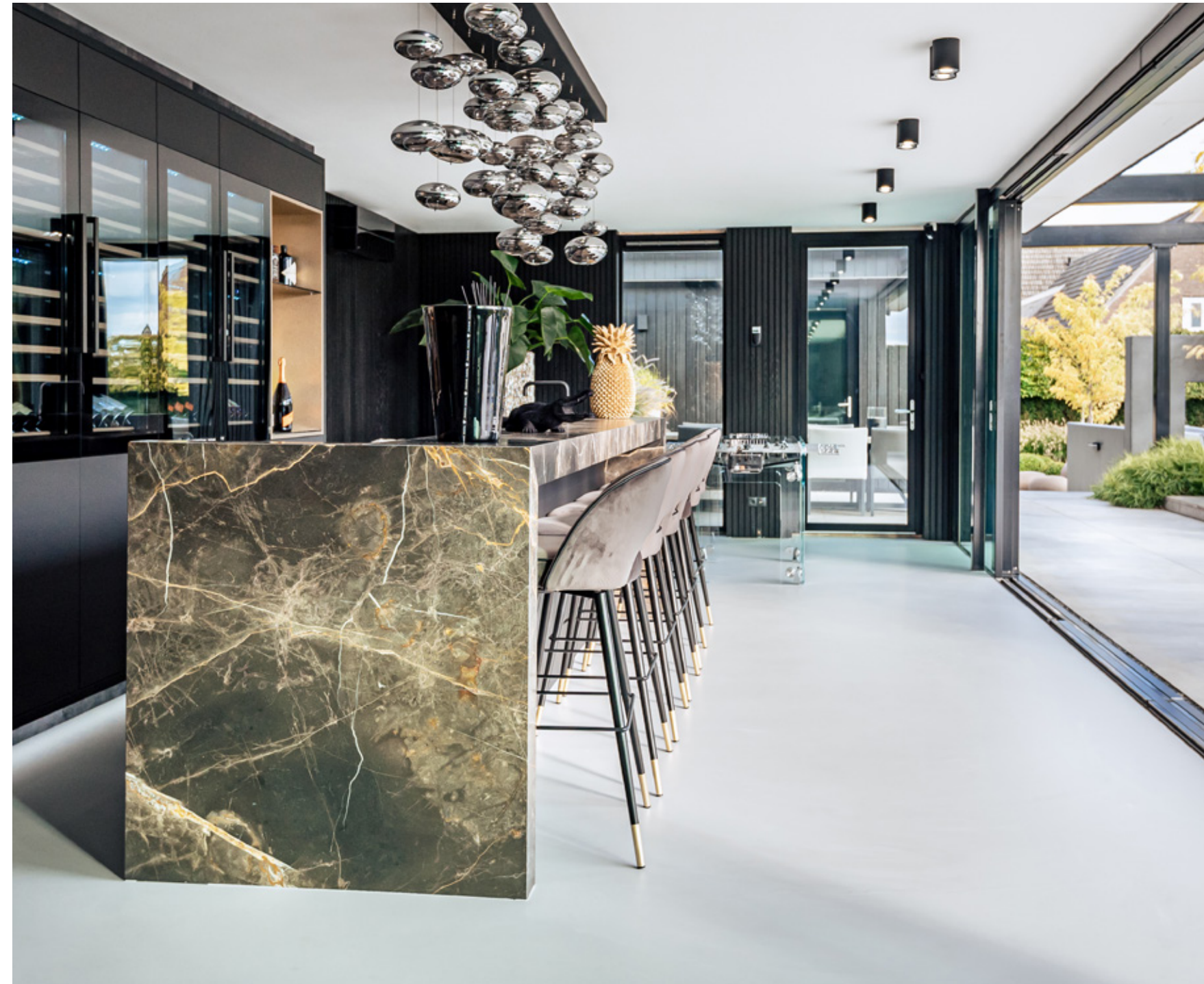
BRONZE FANTASY MARMER • LEATHER-FINISH