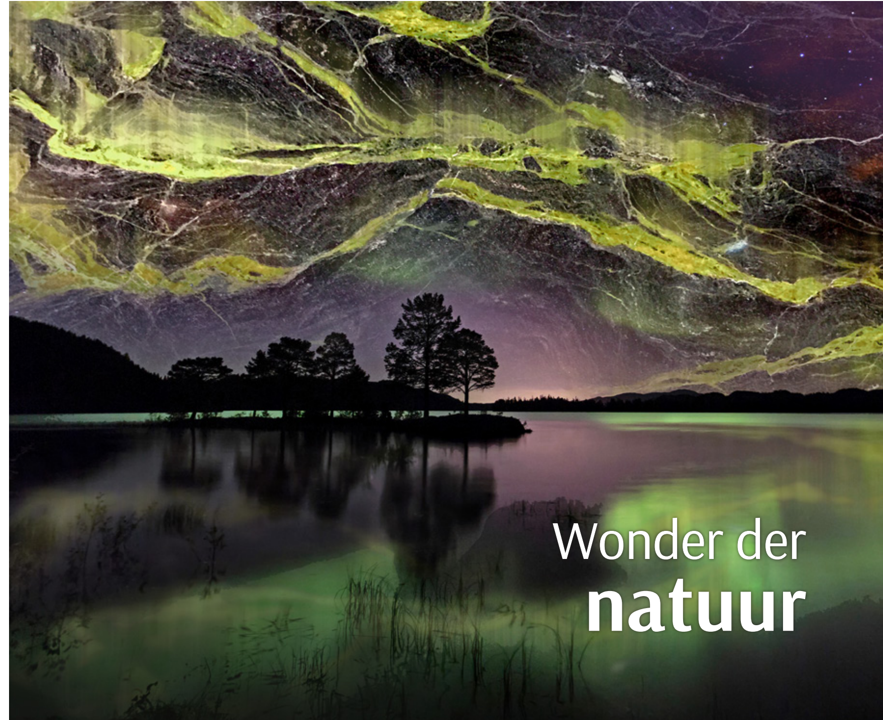
VERDE ESPERANZA KWARTSIET • GEPOLIJS