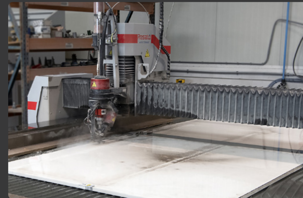
Onze Resato waterjet