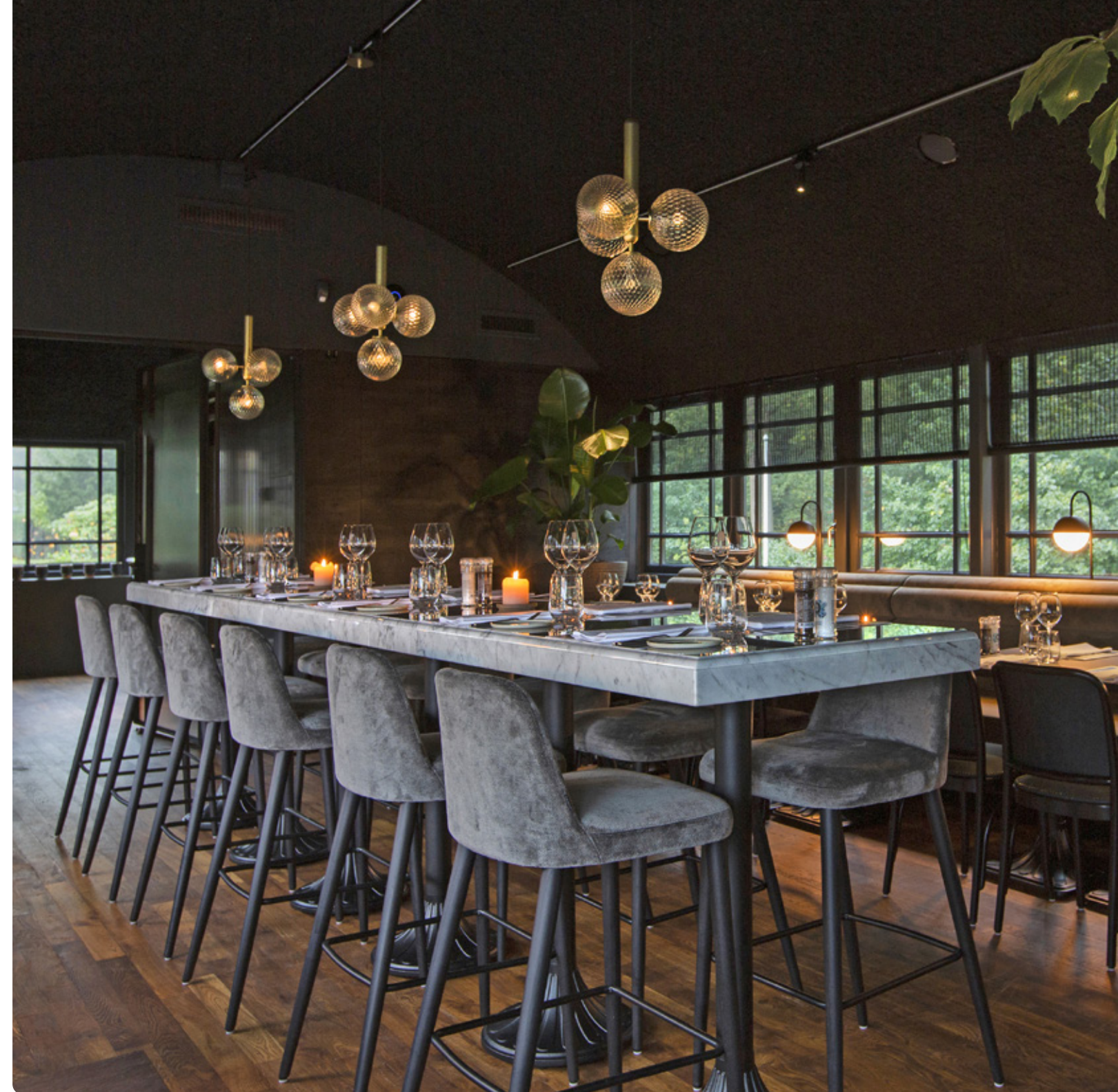
BIANCO CARARRA C MARMER • GEPOLIJD