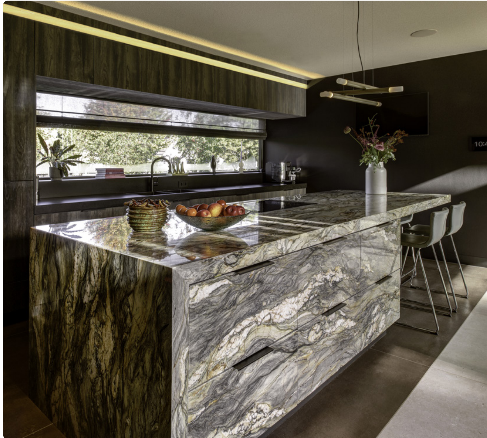
FUSION WOW KWARTSIET • GEPOLIJS