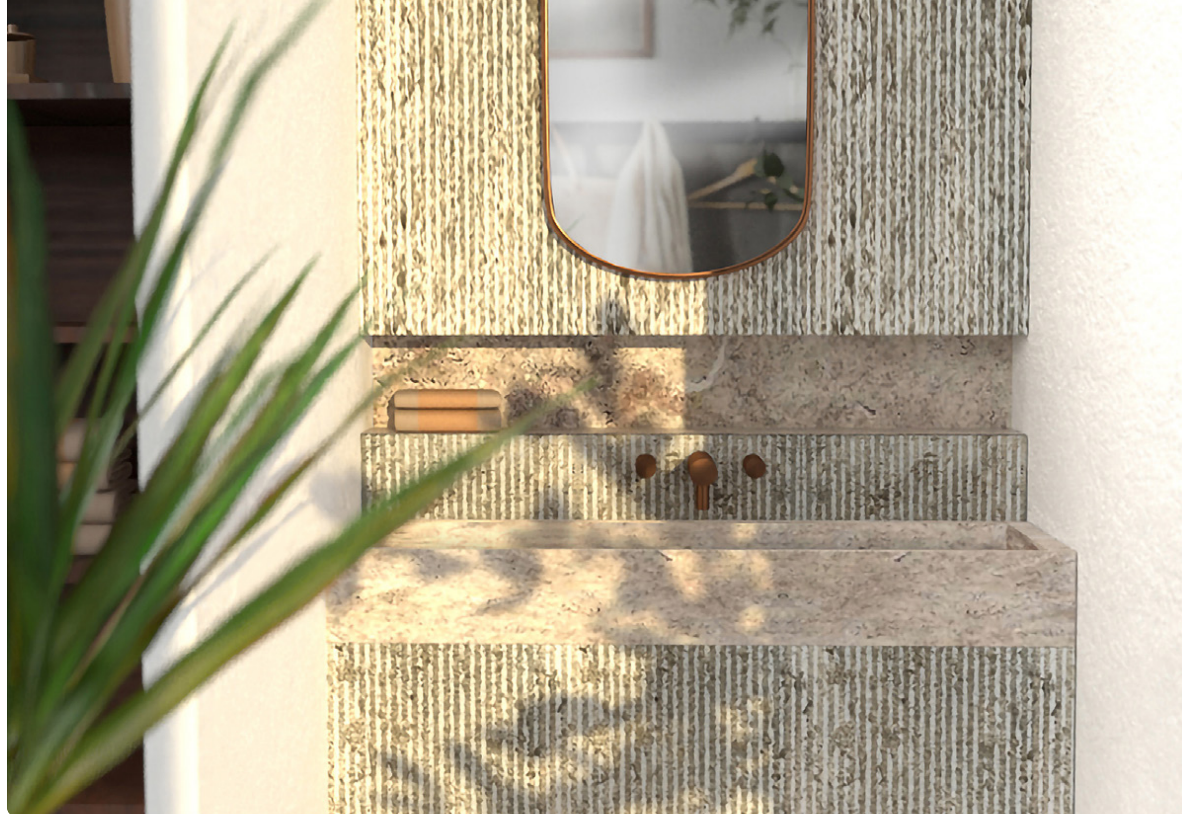
TITANIUM TRAVERTIN • SIENA