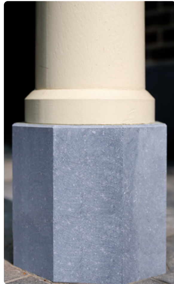
BELGISCH HARDSTEEN • GESCHUURD 120

Deze dorpels, poeren en bordes van Belgisch hardsteen hebben als voordeel dat ze zeer slijtvast zijn. Ze kunnen op elke gewenste maat en vorm worden geleverd. En hoe dikker het hardsteen is dat gebruikt wordt, hoe 'deftiger' de uitstraling is. Ons Belgisch hardsteen komt altijd uit de groeve van Carrières du Hainaut.