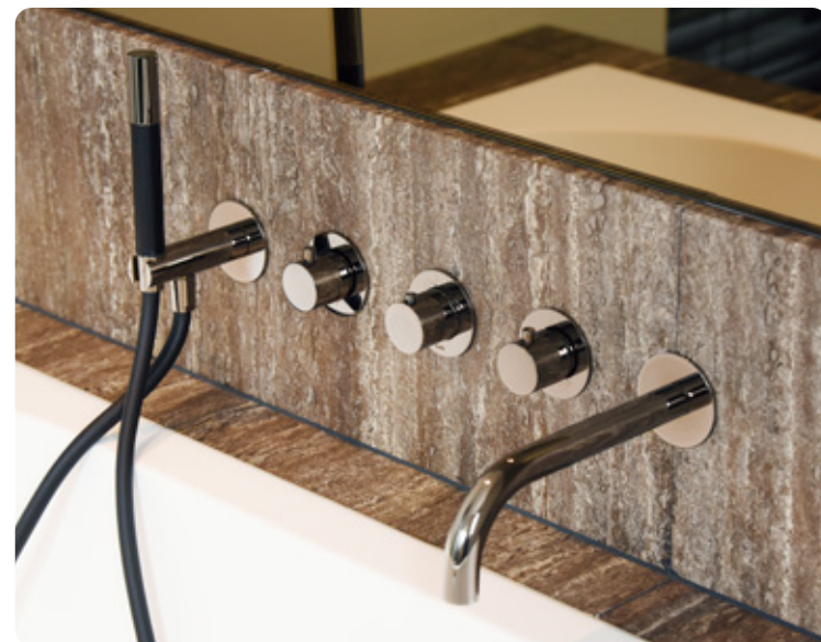
TITANIUM TRAVERTIN • GEZOET & GESTOPT