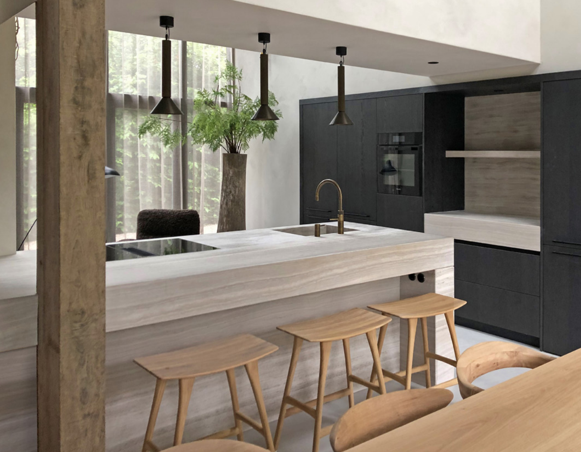
SERPEGGIANTE AVORIO MARMER • LEATHER-FINISH