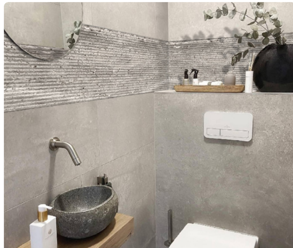
TITANIUM TRAVERTIN • CORTONA

Let op: onze decopanelen zijn alleen projectmatig te verwerken.