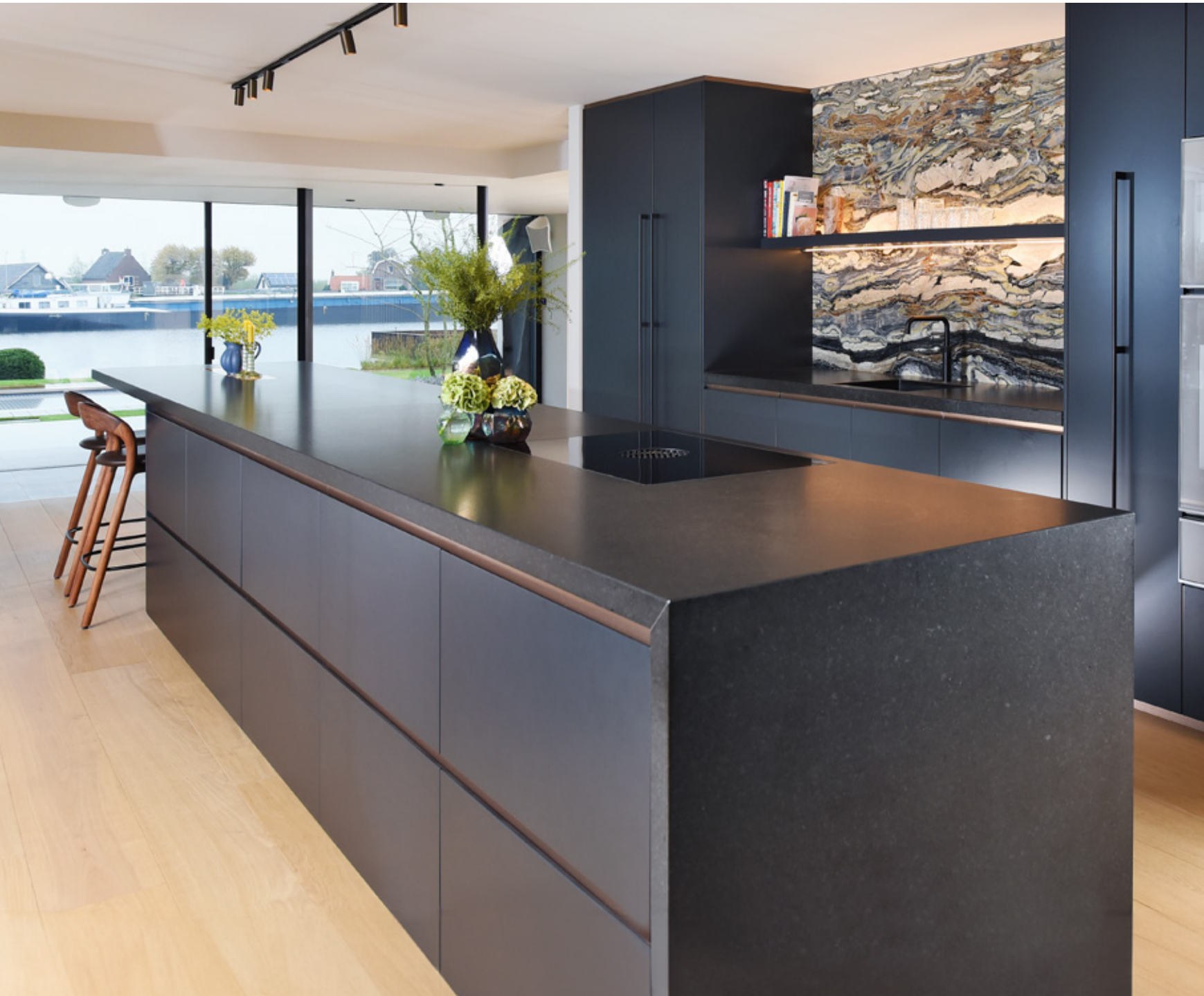
NERO ZIMBABWE GRANIET • SATINO | DEDALUS SOFTKWARTSIET • GEPOLIJS