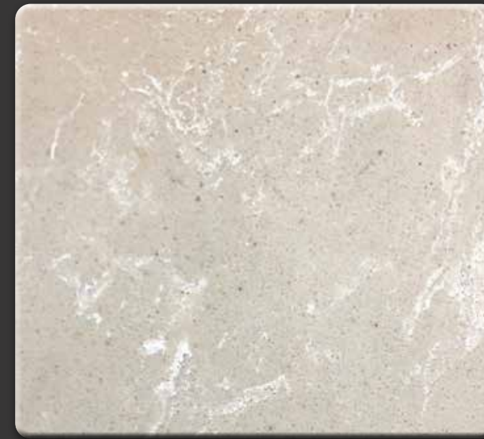
CREMA M · GEPOLIJST