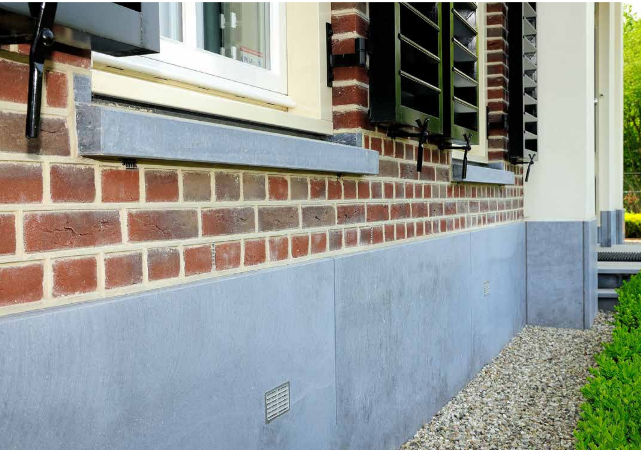
BELGISCH HARDSTEEN · GEVELPLINT

Onze gevelplinten zijn vervaardigd uit hoogwaardig Belgisch hardsteen en zijn onmisbare elementen aan de buitenzijde van de woning. Deze elementen zijn meer dan alleen maar decoratief. Als beschermende barrière bieden gevelplinten niet alleen een fraaie overgang tussen gevel en grond, maar voorkomen ze ook schade en vervuiling van de gevel.