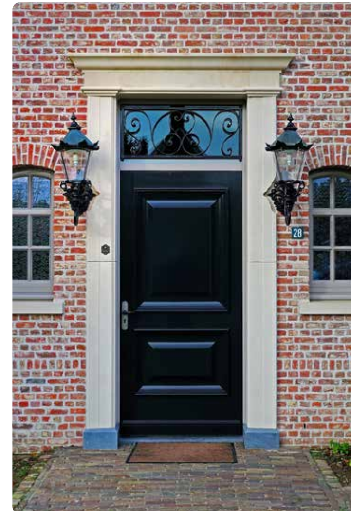
FRANS ZANDSTEEN • DEUROMLIJSTING