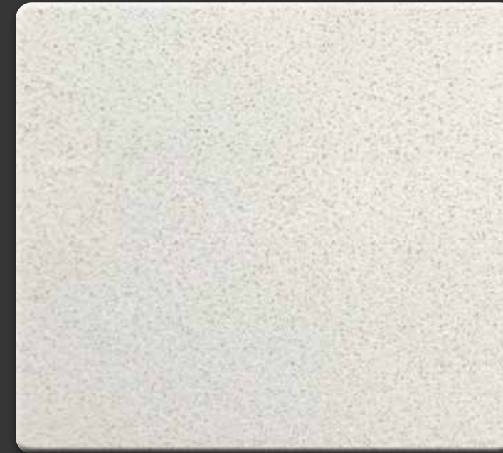
CRYSTAL WHITE · GEPOLIJST