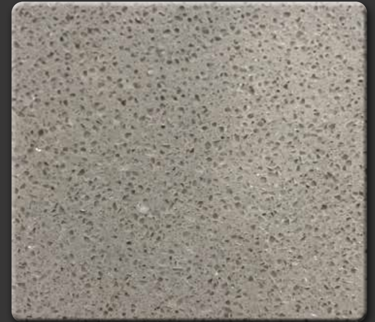
GREY F · GEPOLIJST