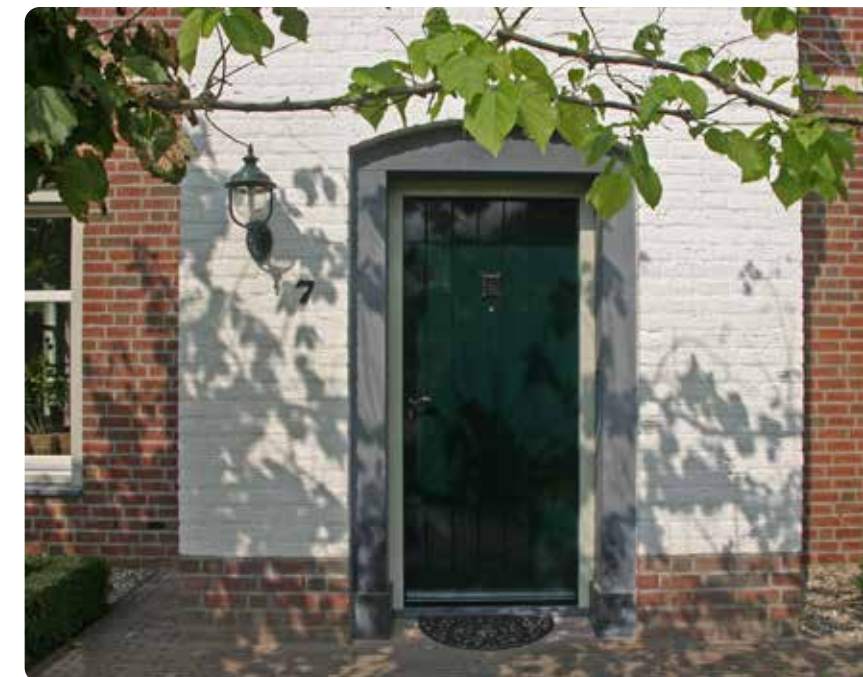
BELGISCH HARDSTEEN • DEUROMLIJSTING

Een deuromlijsting bestaat uit 2 verticale delen [pilasters], het horizontale gedeelte, de bovendorpel en een deurdorpel. Dorpels en pilasters vormen samen een geheel en zijn uit één soort materiaal gemaakt. Onze Belgisch hardstenen en zandstenen deuromlijstingen vormen de architectonische omlijsting van iedere entree, met de perfecte combinatie van functionaliteit en esthetiek. Maatwerk deuromlijstingen worden in onze eigen productie gemaakt.