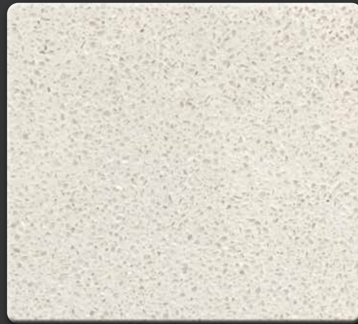
BIANCO C · GEPOLIJST