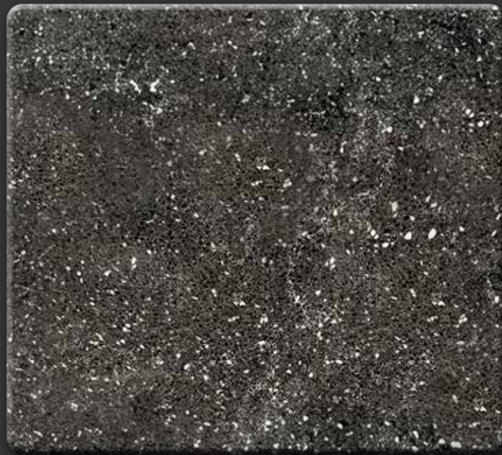
BLUE F · GEPOLIJST

Marmmercomposiet zorgt voor een mooie uitstraling tegen een zeer interessante prijs. De Ariës Collectie Marmmercomposiet is een door ons zelf ontwikkelde collectie en is met name geschikt voor vensterbanken. Hij bestaat uit 6 verschillende uitvoeringen marmmercomposiet. Daarom is dit materiaal altijd gunstig geprijsd en altijd op voorraad en dus snel leverbaar. Houdt er rekening mee dat marmmercomposiet kalk bevat en daarom niet zuurbestendig is.