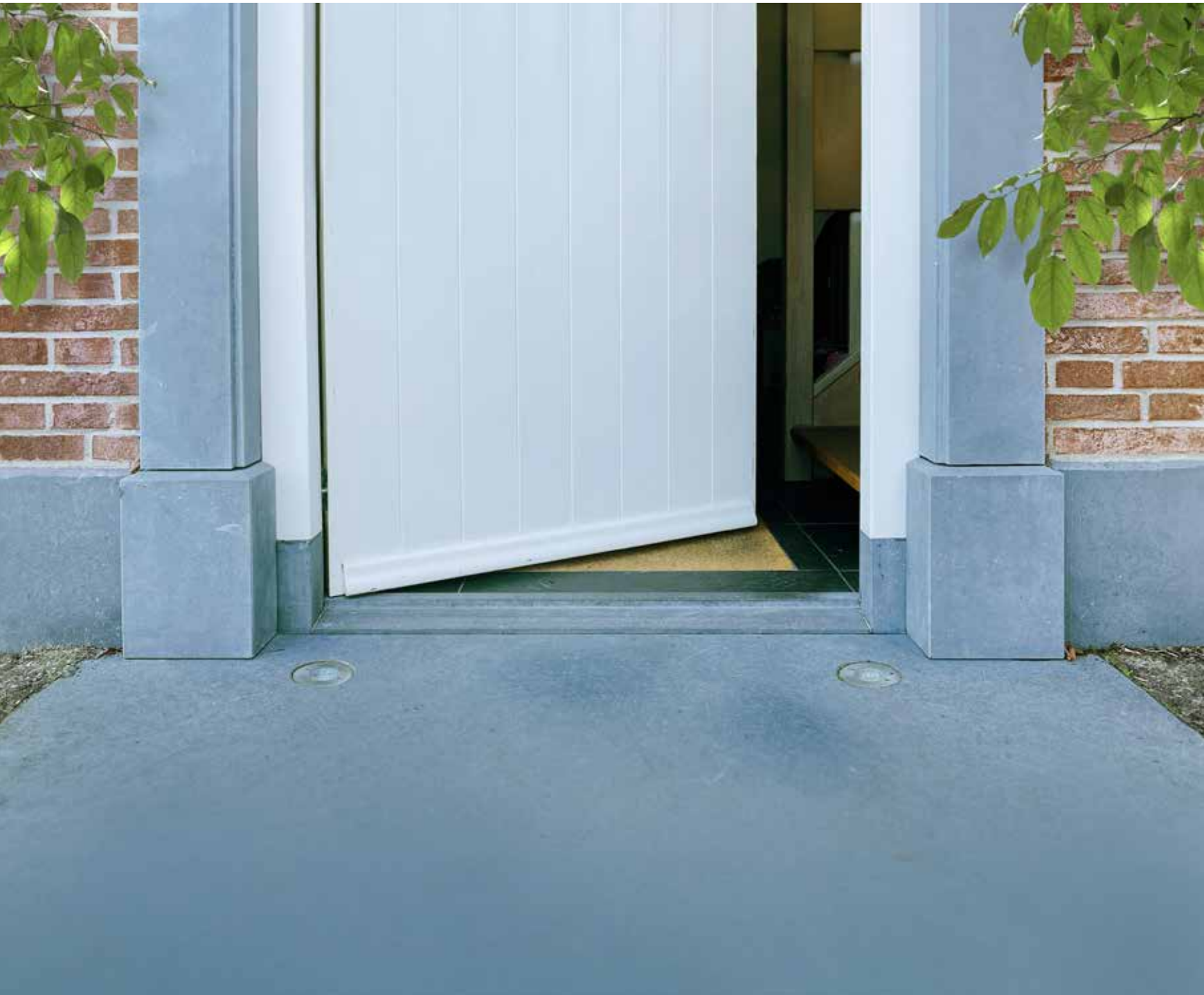
BELGISCH HARDSTEEN • DEURDORPEL EN STOEPPLAAT