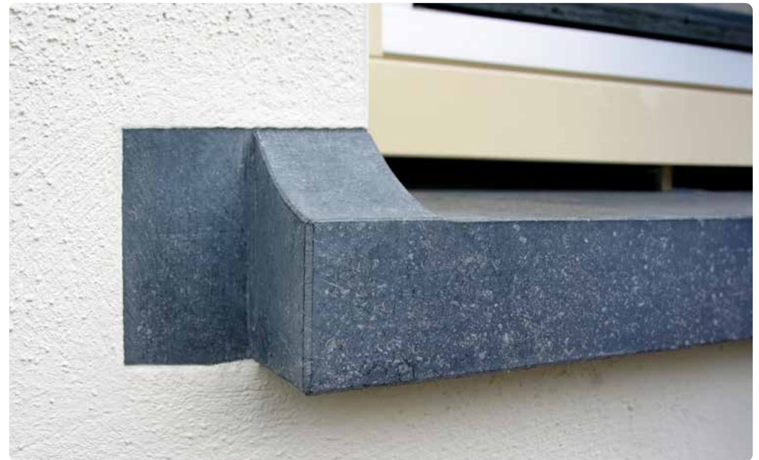
BELGISCH HARDSTEEN • RAAMDORPEL

Onze Belgisch hardstenen dorpels en neuten dienen als stevige fundamenteën voor ieder bouwproject. Deze elementen, vervaardigd met toewijding in eigen beheer, gaan verder dan enkel esthetiek. Ze bieden een bescherming tegen de weersinvloeden. De zorgvuldig afgewerkte dorpels en neuten leveren daarmee een essentiële bijdrage aan de bouwkwaliteit van woning of [kantoor]gebouw.