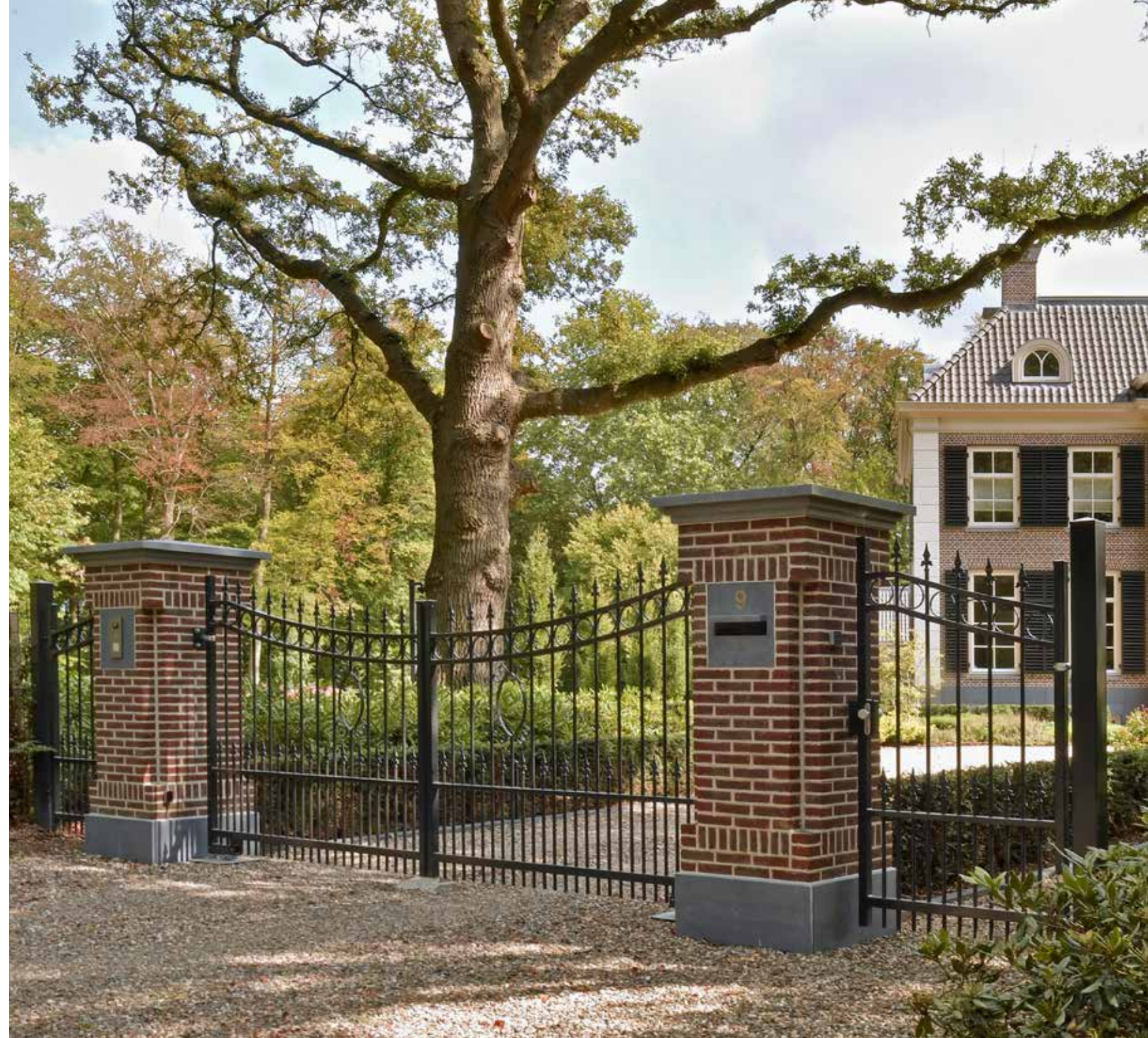
BELGISCH HARDSTEEN • POERAFDEKKERS