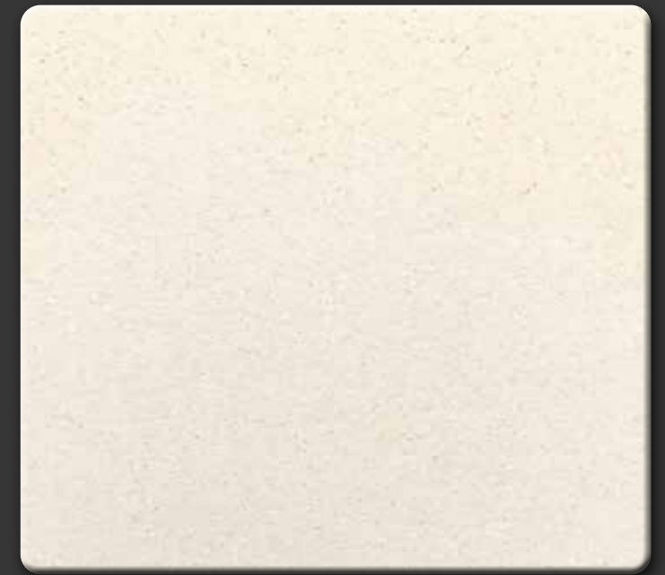
BEIGE F · GEPOLIJST