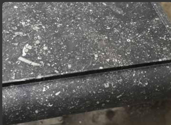
BELGISCH HARDSTEEN · CRINOÏDEN

Al onze hardsteen bouwmaterialen zijn gemaakt van 100% Belgisch hardsteen uit de groeve van Carrières du Hainaut. Ariës Natuursteen is een officiële verdeler van dit materiaal uit Henegouwen en wij maken alleen gebruik van de Super- en Courant kwaliteit steen. Carrières du Hainaut garandeert de herkomst en de absolute kwaliteit van elke steen met een certificaat van oorsprong. Dit genummerde certificaat wordt afgeleverd bij aankoop van afgewerkte en half-afgewerkte producten van Carrières du Hainaut en gevalideerd door een unieke code en keurmerk.