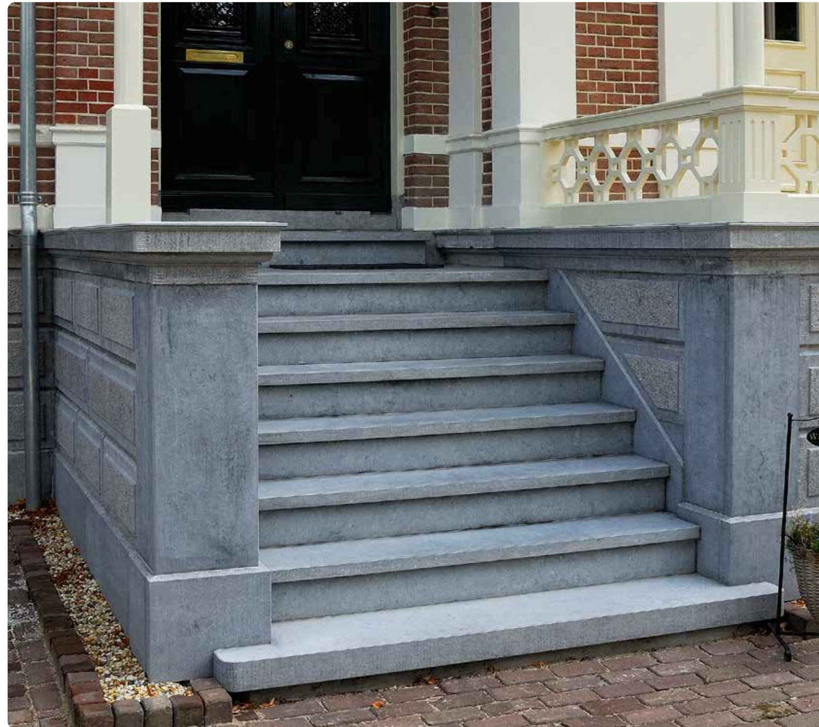
BELGISCH HARDSTEEN • BORDES